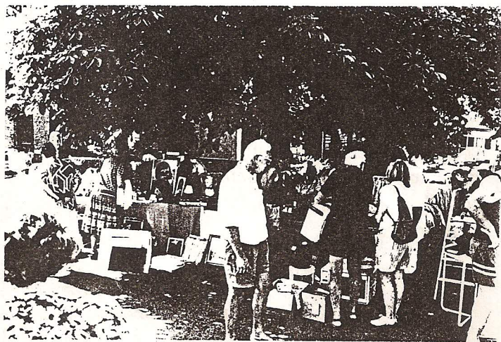
La foire à la brocante du particulier de Noyers

Les façades de la mairie et de l'école viennent d'être refaites.