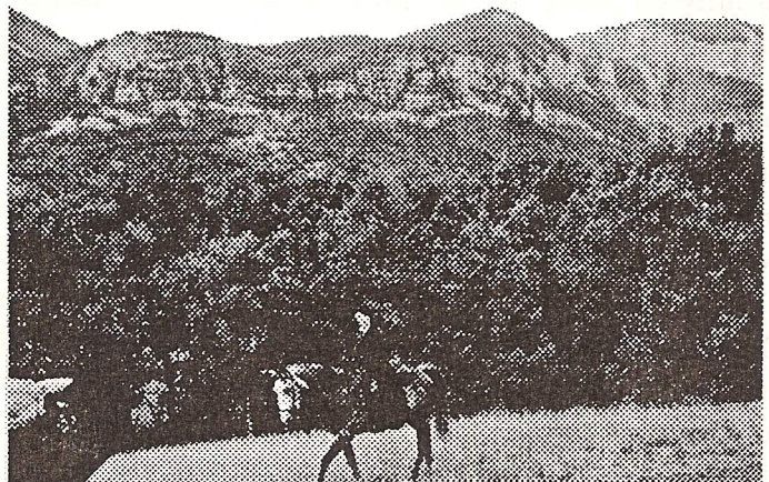
Pauline de Théüs (Juliette Binoche) à cheval dans la Vallée

Et pourquoi pas un jour une randonnée sur le thème du hussard?