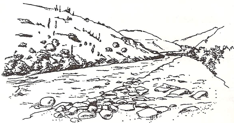
Dessin Bernard Nicolas

Offices religieux : aucune précision possible, se renseigner au presbytère à Sisteron au 04.92.61.14.81.