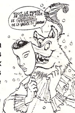
(Dessin de B. NICOLAS)

Le Carnaval de la vallée, qui partira de Valbelle vers 14 h pour visiter toutes les communes de la vallée et arriver aux Omergues vers 16 h. Les enfants tenteront d'ouvrir des pifatas remplies de bonbons et de surprises. Après le goûter, Caramantran sera brûlé en place publique!