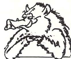
D'après B. NICOLAS

Et si c'était lui, le bug de l'an 2000 ?