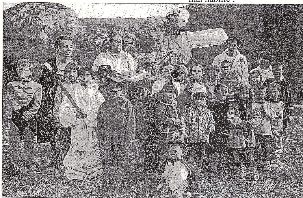
Le carnaval a permis aux jeunes de tous les villages de la vallée du Jabron de se retrouver, l'espace de quelques heures bien sympathiques.

* Dans le Midi, si l'on vous traite de Caramantran (ou Calamantran ), ce n'est vraiment pas un compliment. Soit vous avez un caractère impossible, soit vous êtes mal habillé !