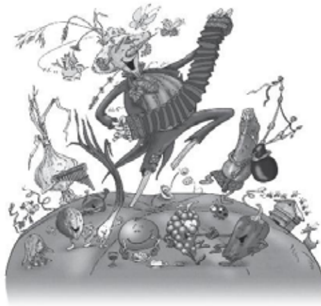
Illustration: Bernard Nicolas - www.danselombre.com

Compagnie du FOL ESPOIR : déambulations et spectacle en extérieur près des artisans le samedi et le dimanche après midi