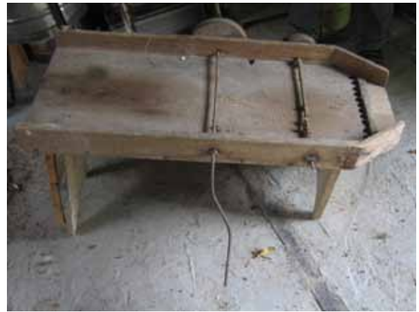
ancien dévidoir à cocon