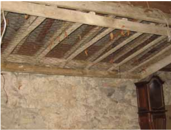
la canisse pour l'élevage des vers à soie

Toutes les maisons faisaient du ver à soie. Il y avait beaucoup de mûriers. Ces derniers ont disparu parce que seule une coupe régulière leur permet de survivre. Si on ne le fait pas, leurs branches deviennent trop lourdes pour le vieux tronc et l'arbre s'effondre. C'est ce qui s'est passé un peu partout car l'avènement du nylon après guerre a sonné l'arrêt de la culture du ver à soie. »