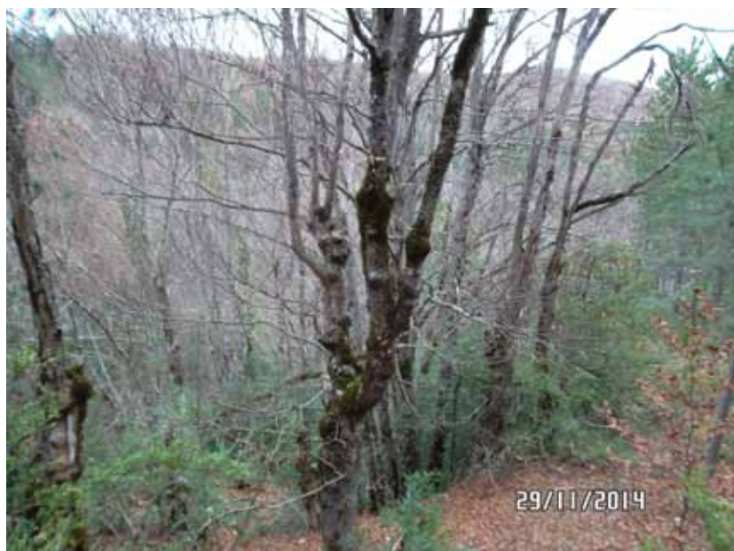
Chênes trognés aux Ponchettes à Valbelle

Un prochain numéro reprendra ce thème ; alors n'hésitez pas à nous envoyer vos photos de trognés par email avec quelques commentaires sur l'arbre et quelques suppositions sur l'usage dont il serait témoin : vivreaujabron@yahoo.fr