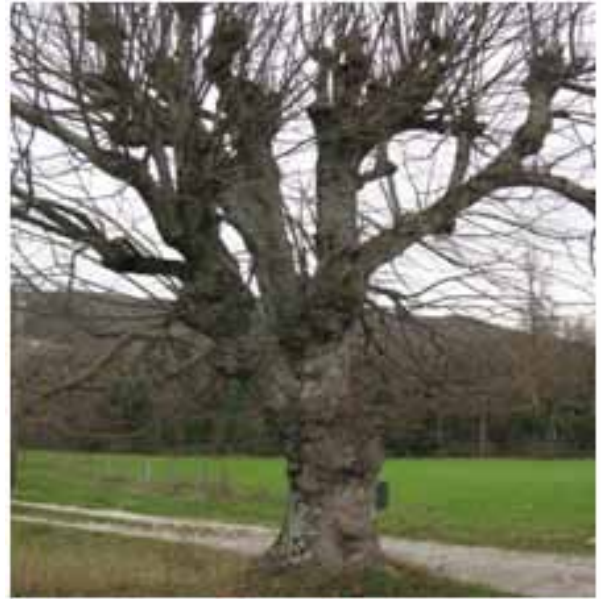
Tilleul à l'entrée de Noyers sur Jabron