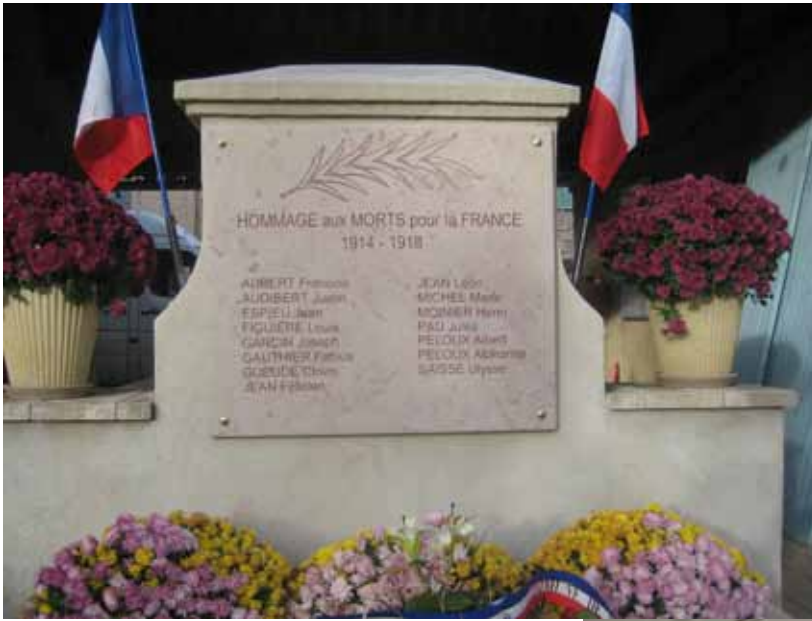
Monument aux Morts de MONTFROC