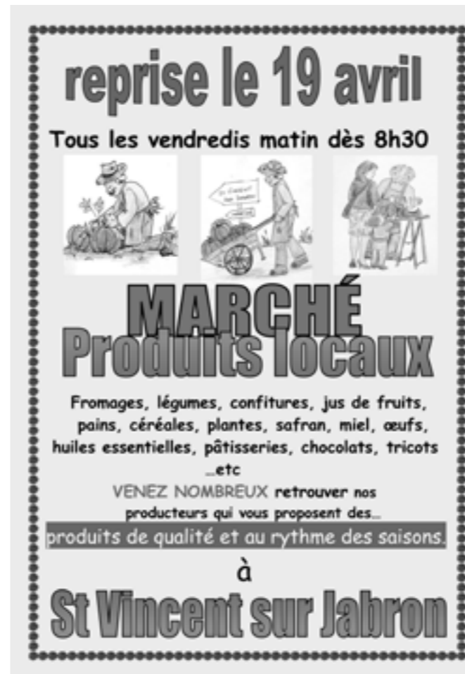
Les nouvelles des communes sont communiquées par les mairies.

Pas d'information communiquée ce trimestre.