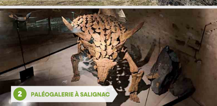
2 PALÉOGALERIE À SALIGNAC