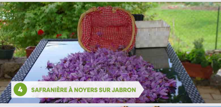
4 SAFRANIÈRE À NOYERS SUR JABRON