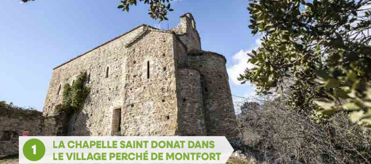
1 LA CHAPELLE SAINT DONAT DANS LE VILLAGE PERCHÉ DE MONTFORT