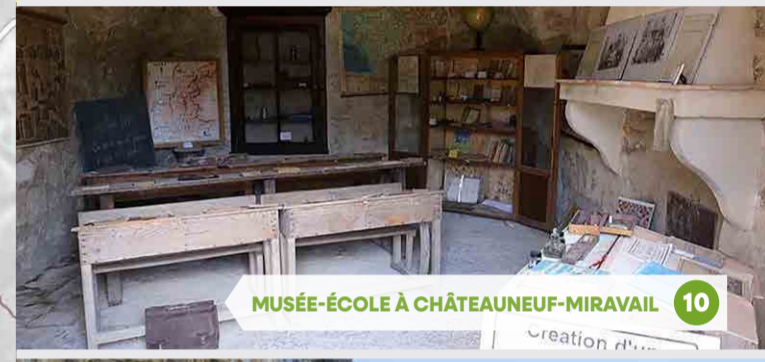
10 MUSÉE-ÉCOLE À CHÂTEAUNEUF-MIRAVAIL