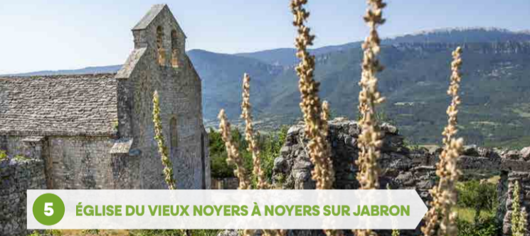
5 ÉGLISE DU VIEUX NOYERS À NOYERS SUR JABRON