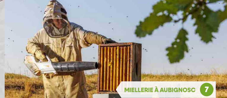
7 MIELLERIE À AUBIGNOSC