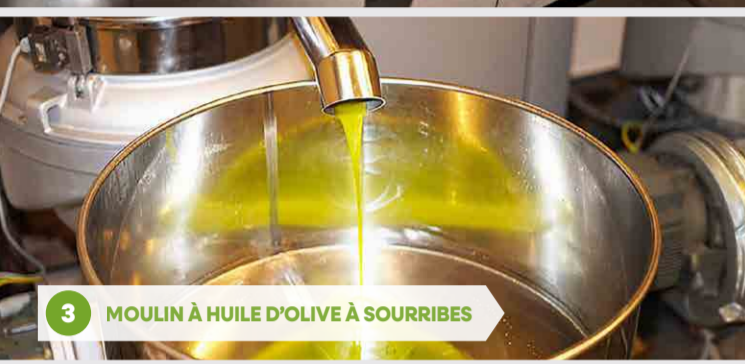
3 MOULIN À HUILE D'OLIVE À SOURRIBES