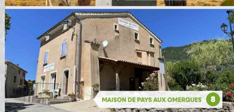
8 MAISON DE PAYS AUX OMERGUES