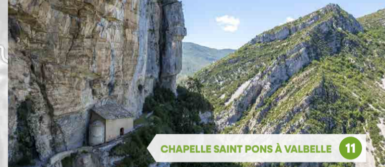
11 CHAPELLE SAINT PONS À VALBELLE