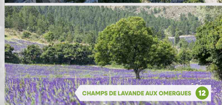
12 CHAMPS DE LAVANDE AUX OMERGUES