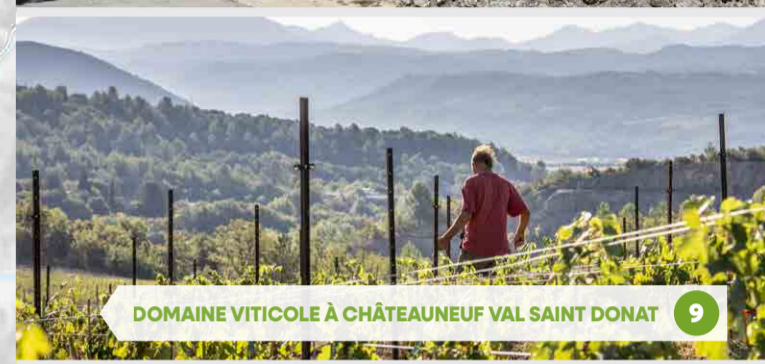
9 DOMAINE VITICOLE À CHÂTEAUNEUF VAL SAINT DONAT