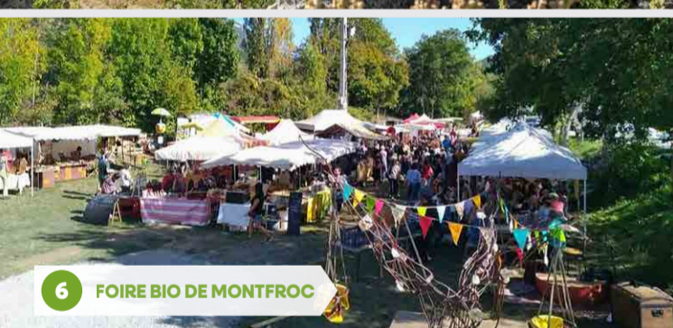
6 FOIRE BIO DE MONTFROC